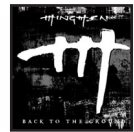
«Back To The Ground». Disques Office. www.mingmenmusic.com

«Back To The Ground», le deuxième album mature d'un groupe qui a les pieds sur terre. Ayant retrouvé le feu, il ne renonce cependant pas à viser les étoiles.