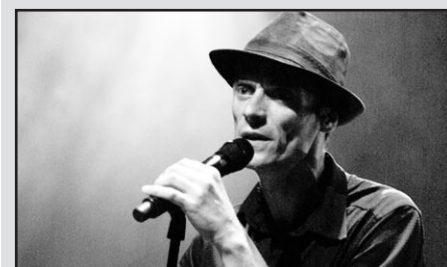
Mano Solo au Corbak Festival de la Chaux-de-Milieu en 2008.

Le chanteur français Mano Solo est décédé à Paris à l'âge de 46 ans des suites de plusieurs anévrismes. Il avait remporté trois disques d'or. Mano Solo avait été hospitalisé après son dernier concert à l'Olympia à Paris, le 12 novembre dernier. «Il a lutté courageusement pendant deux mois et jusqu'au bout contre plusieurs anévrismes», a indiqué sa famille. Auteur, compositeur et chanteur, Mano Solo a signé de nombreux albums teintés de rythmes africains, d'airs de tangos et de rengaines de faubourgs parisiens, aux paroles poétiques évoquant les problèmes contemporains. Mano Solo avait notamment chanté sur le sida, dont il était atteint. Il était depuis de nombreuses années sous trithérapie. ATS